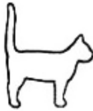
Ik ben blij om je te zien!