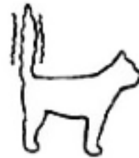
Ik ben dol op jou!