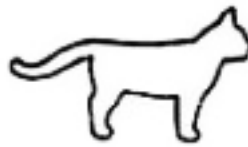
Ik ben geïnteresseerd