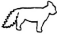
Ik ben bang