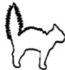
Ik ben boos!