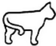
Ik ben in een amoureuze bui