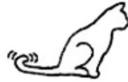
Ik ben geïrriteerd