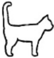
Ik ben vriendelijk